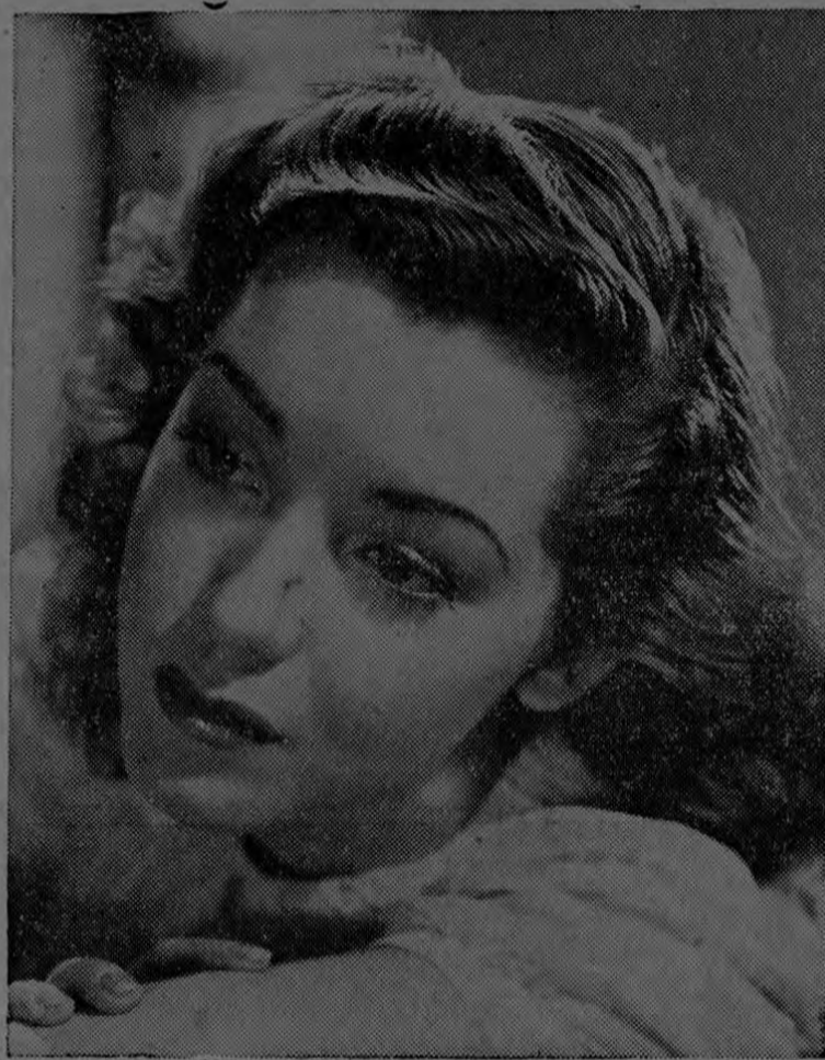
Fijese en MARSHA HUNT, la gran cantante del estudio Metro-Goldwyn-Mayer, y en cómo su arreglo y su peinado reflejan la gloriosa juventud de que puede sentirse orgullosa, como afirma Max Factor, Jr.