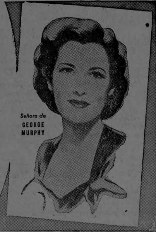
Señora de GEORGE MURPHY

Distribuidores: ALMACEN PALACIOS — San José