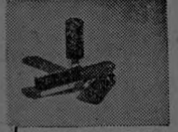
CREYON de LABIOS Superindeleble... a prueba de humedad... conservará sus labios suaves y uniformes todo el día.