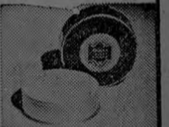
POLVO FACIAL En armoniosos colores para rubias, brwnettes, pelirrojas o triguñeras.

Nada hay mas perjudicial a la belleza que la selección casual de los colores del maquillaje. Por eso es que las atractivas estrellas cinematográficas como Betty Grable confían sólo en el MAQUILLAJE EN ARMONIA DE COLORES, creado por MAX FACTOR * HOLLYWOOD. Para compartir con las estrellas el secreto de cómo seleccionar los tonos de POLVO, COLORETE Y CREYON que forman su ARMONIA DE COLORES individual, sencillamente tiene usted que llenar este cupón y enviarlo hoy mismo a la dirección en él detallada.